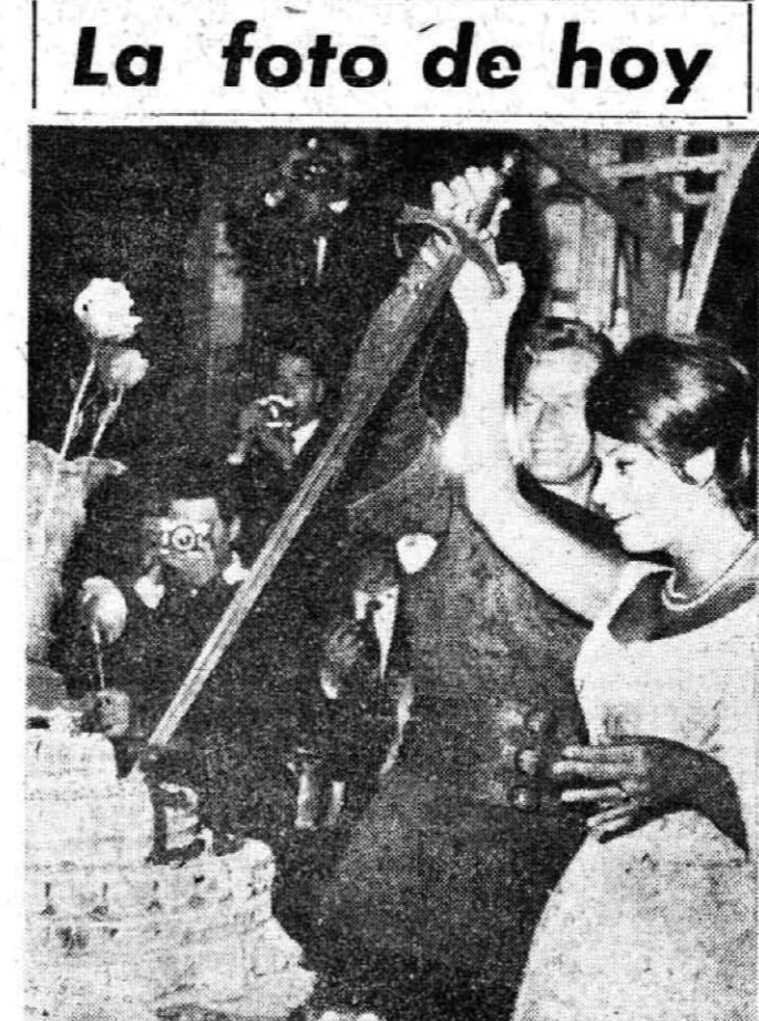
La foto de hoy