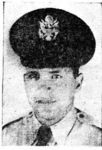
Powers, piloto del U-2 derribado por los rusos