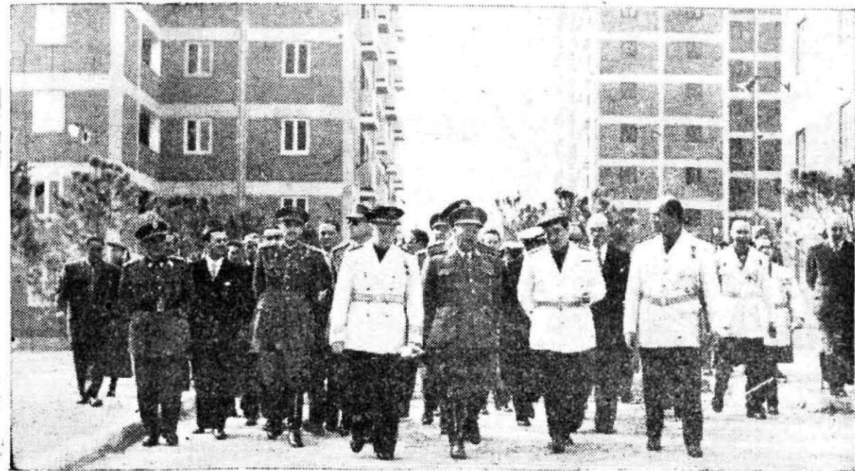
Sobre la nueva realidad de España se alzan las gigantescas edificaciones que han venido a resolver en gran parte el agudo problema nacional de la vivienda. Es el signo renovador de la victoria alcanzada el 1 de abril.

Más de diez mil viviendas han sido construidas en nuestra ciudad