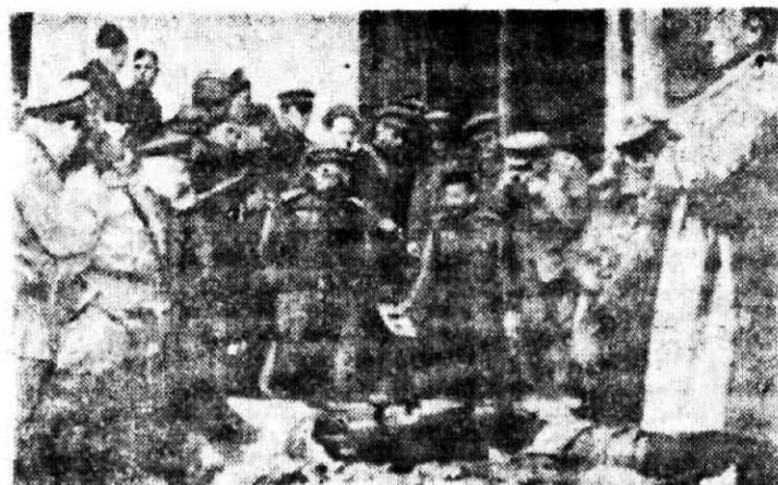
Soldados del Ejército rojo se aglomeran alrededor de un cadáver que fue considerado algunos instantes como el de Hitler.