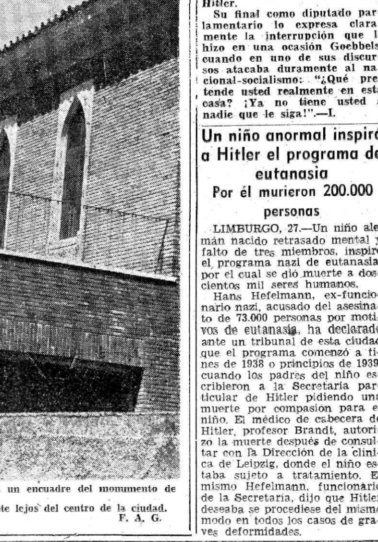
La foto de ayer nos ofrecía un encuadre del monumento de Colón. La de hoy está hecha bastante lejos del centro de la ciudad. F. A. G.