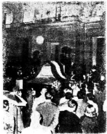
Ante el túmulo cubierto con la bandera francesa frente a la Colunata de los Inválidos, París, después a su pintor, Georges Braque.