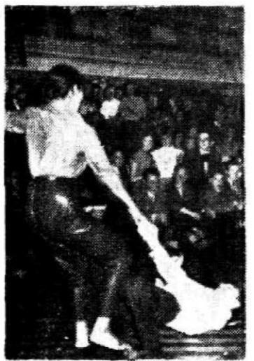
Escenas alocadas y tumultuosas como éstas, provocadas por los "scopains" y los "scopines" de la canción, se repiten demasiado alarmantemente en el mundo de hoy.

Tras ya innumeras incidentes y escándalos, los actos de grave violencia producidos en París, con motivo del festival del twist, auténtica crisis de histeria colectiva, digna de la Edad Media o del Vedón antillano, en el curso de la cual una muchacha de 16 años fue apellada en plena calle; la cuestión del desequilibrio mental de los "fans", cambreros y, como consecuencia, de toda una parte de la juventud francesa, se ha planteado públicamente.