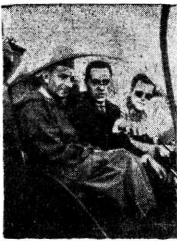
En vida de su padre, Mohamed V, Hassan podía permitirse viajar en helicóptero, como en la foto. Ahora, mientras llega un heredero, sólo puede viajar en tren y barco.

El joven Hassan II, Rey de Marruecos, visitó recientemente Estados Unidos: hizo la travesía en un buque personal y llegó a Washington en tren; en tren está previsto igualmente su viaje por Francia y el que efectuará a Alemania y la Unión Soviética. Cuando todos los hombres de Estado, incluido el anciano Adenauer, se desplazan en jets, estos viajes en tren del Soberano marroquí aparecen como un chocante anacronismo.