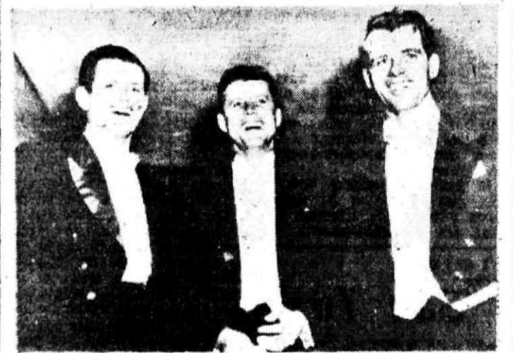
Los tres hermanos Kennedy, en su apogeo: Edward, senador de Massachusetts; John Fitzgerald, Presidente; y Robert, fiscal general del país.