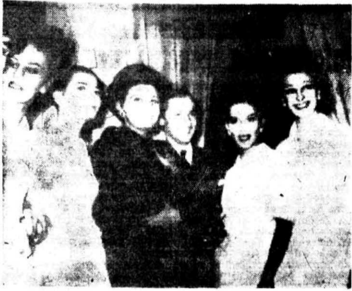
PARIS. — Un grupo de maniqués son felicitadas por la actriz italiana Sofia Loren...

"He pasado muchos años en los Estudios escribiendo guiones, y considero que una novela y una película son dos cosas diferentes", nos dice Irwin Shaw