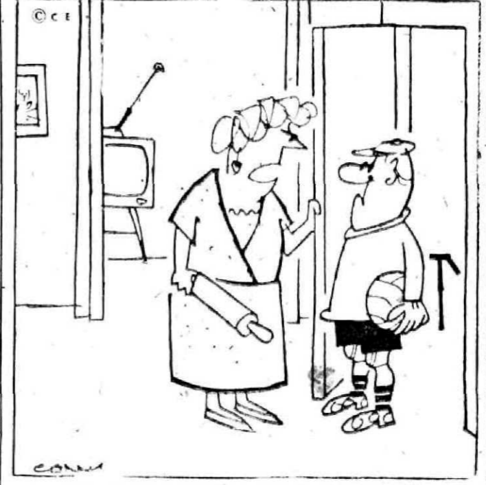
—Y ahora, quieres explicarme cómo te han hecho aquel gol tan tonto!...