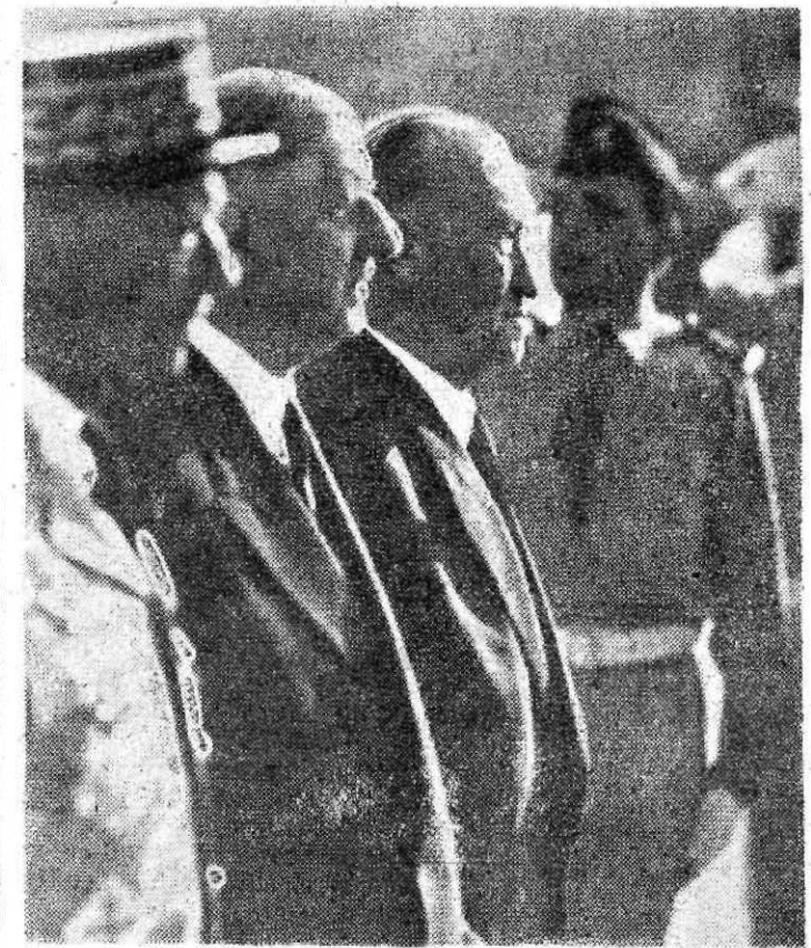
El canciller alemán ha llegado a París para celebrar importantes conversaciones con el Presidente francés sobre el ingreso de Inglaterra en el Mercado Común, la unidad política europea y la defensa de la Otan.