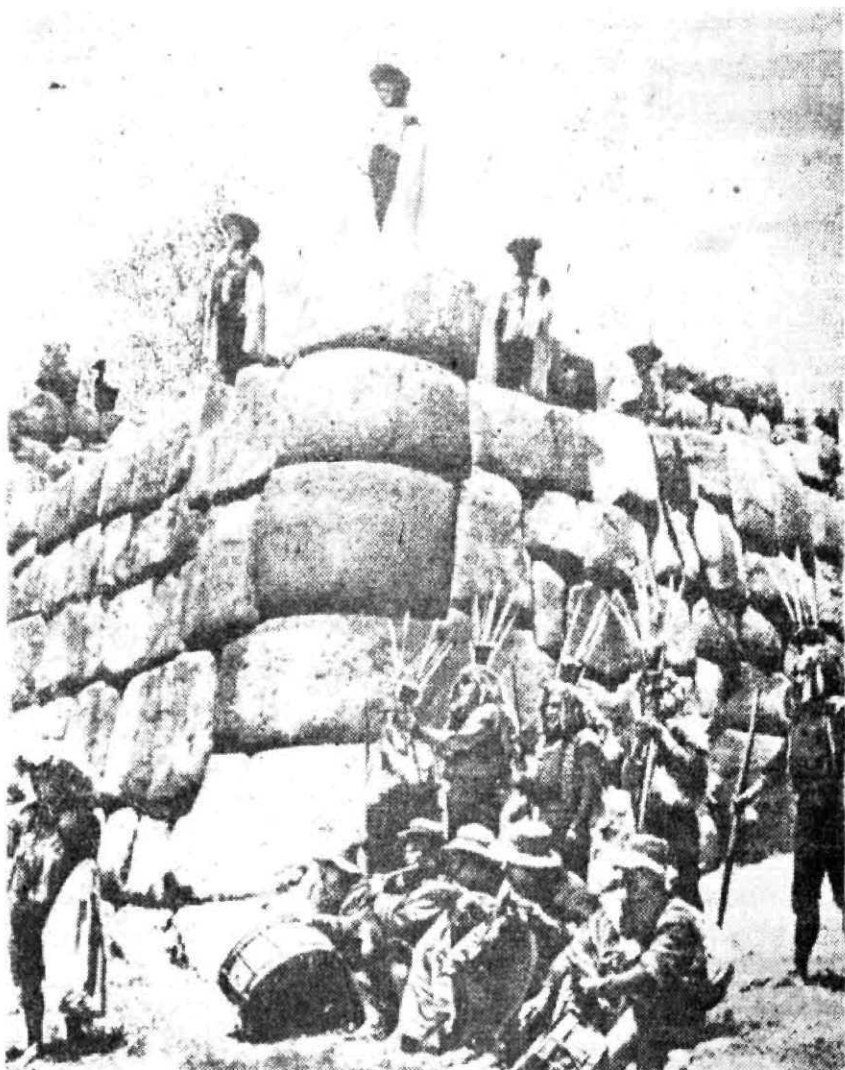
En el escenario enigmático de las ruinas incaicas, estos indios recuerdan los ritos de una civilización perdida que podría proceder del planeta Venus.

Las otras ruinas son numerosas: palacios, templos, fortificaciones, con una especie de "refugios antinevados", escalinatas, monumentos gigantes. Una avenida conduce a un puerto (un puerto casi a 4.000 metros de altura!) cuyo muelle principal mide 90 metros de largo y podía recibir barcos de 45 metros de eslora. La más célebre de estas ruinas es el templo de Kalassassava, de 132 metros de largo por 120 de ancho y que era tal vez