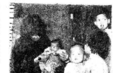
Familia de refugiados en una chabola de Hong Kong.

Debido a la penuria de viveres, por no decir al hambre, que continúa reinando en la China Popular, y también para huir de la dictadura comunista, millares de hombres, mujeres y niños intentan todos los meses escapar de la «China de Pesadilla» para llegar a los enclaves de Macao y de Hong-Kong.